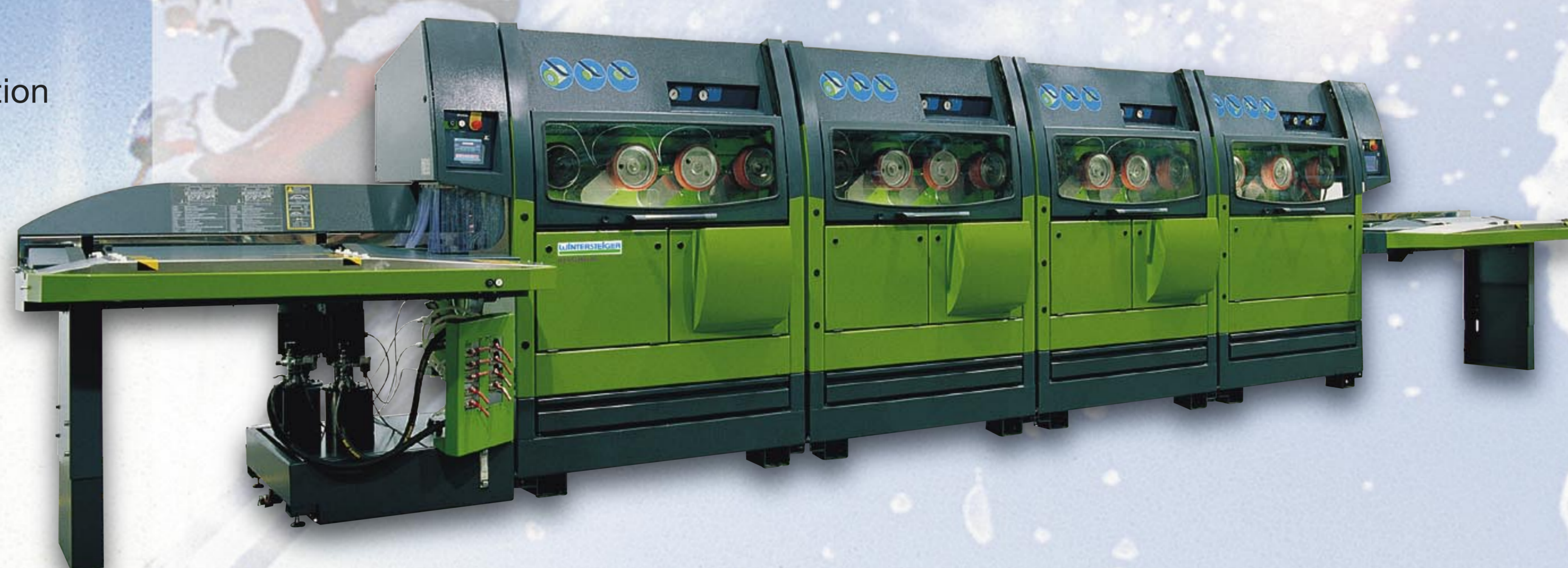
1996 jet shuttle 3C

Modulare, vollautomatische Skiservicestation