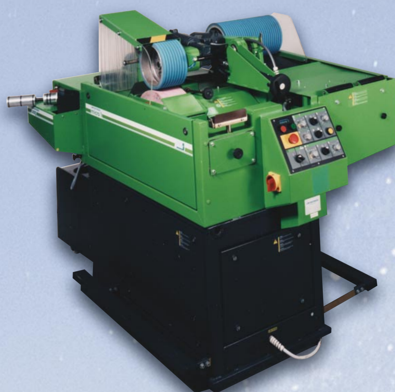
1989 micro 1

Das erste modulare Maschinenkonzept zum Schleifen von Ski und Snowboards