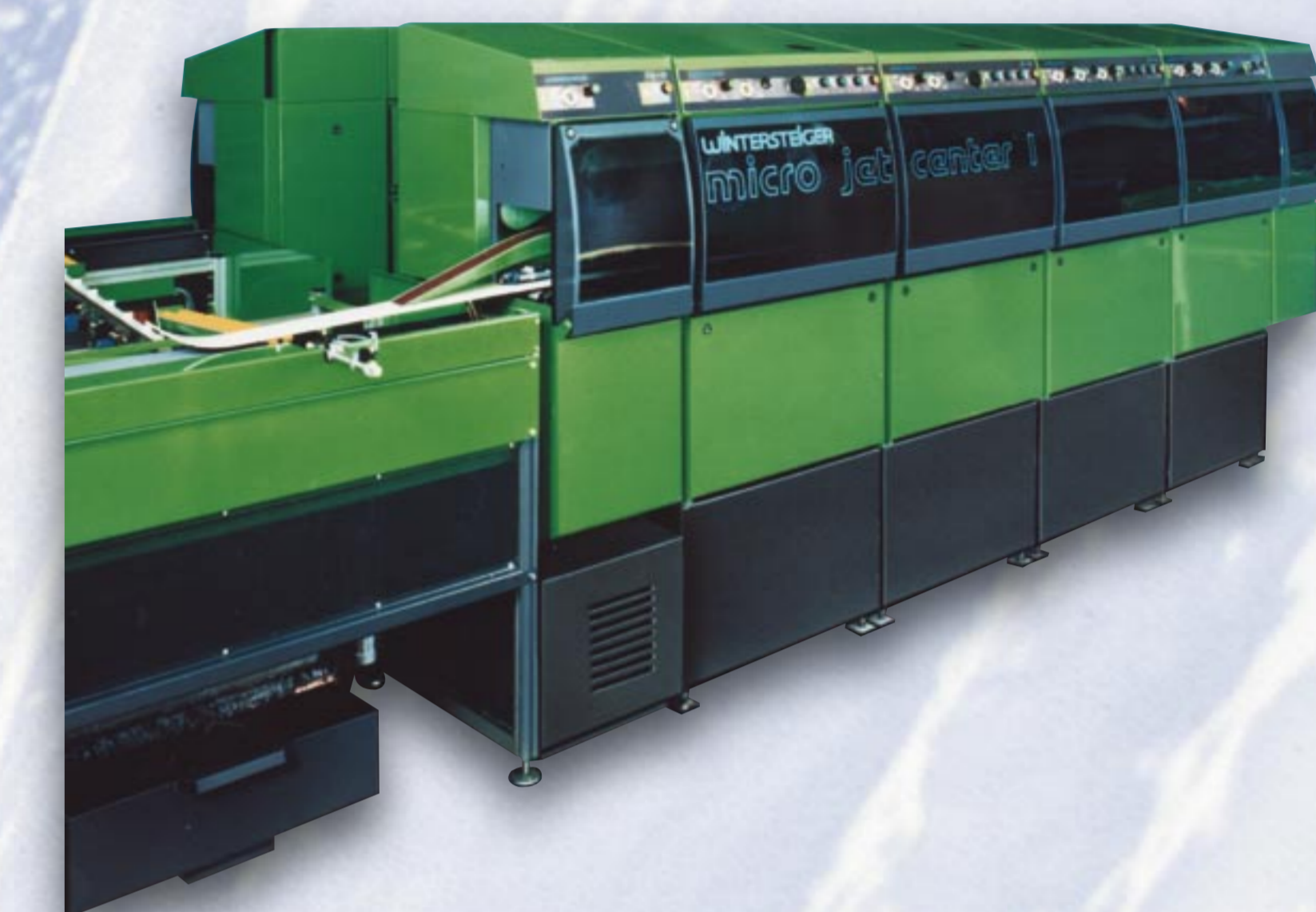
1991 micro jet center

Das 1. vollautomatische Skibearbeitungszentrum: Belagreparatur, Belag- und Kantenschliff, Heißwachsen und Polieren in einer Maschine!