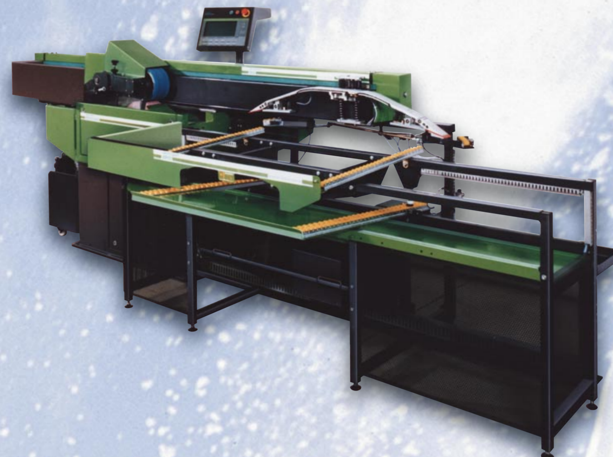
1990 micro center