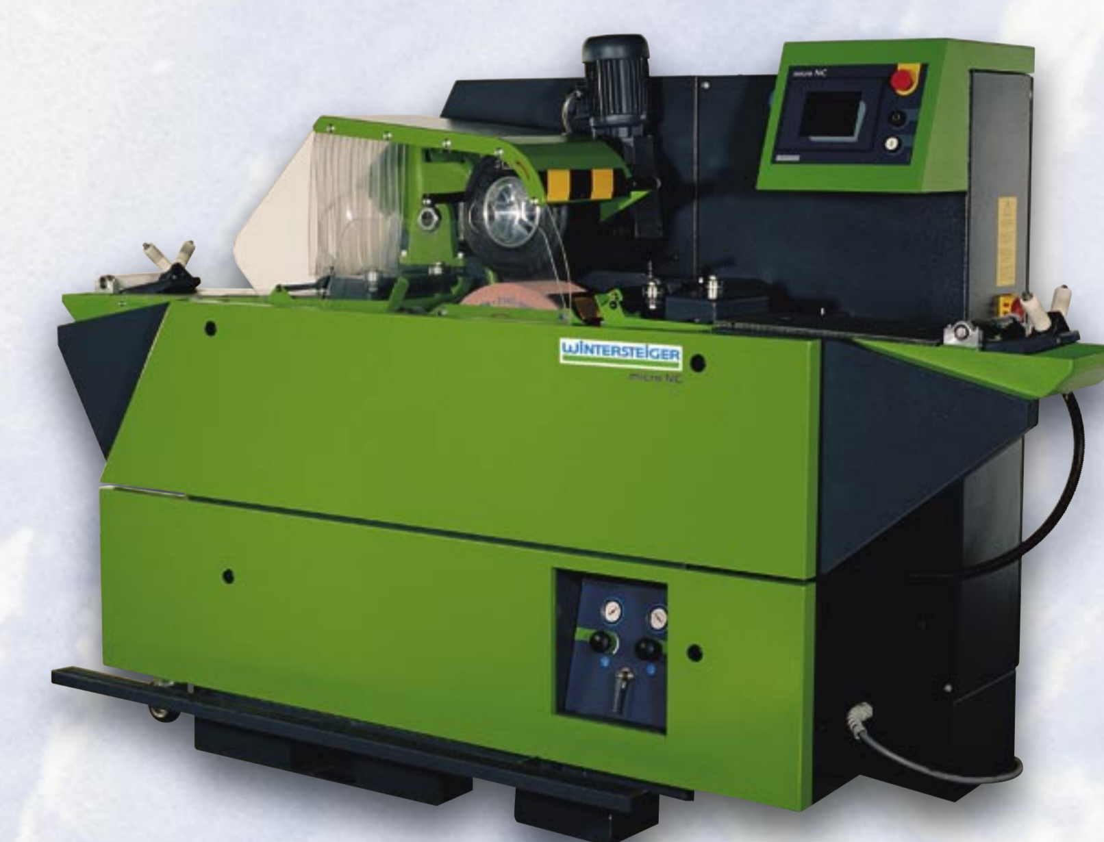
2000 micro NC

CNC-gesteuerte Präzisions-Steinschleifmaschine für den Profirennsport