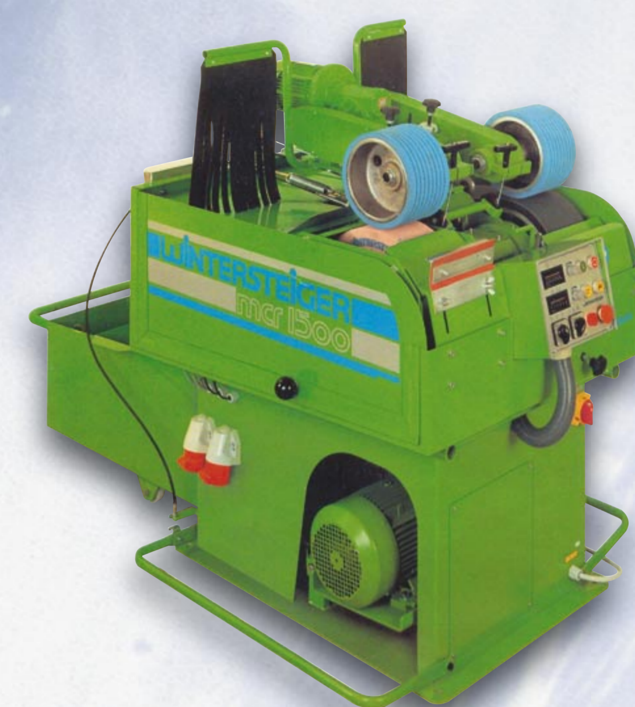
1985 mcr 1500

Mit der mcr-Serie gelang der Durchbruch zum Weltmarktführer im Skiservice