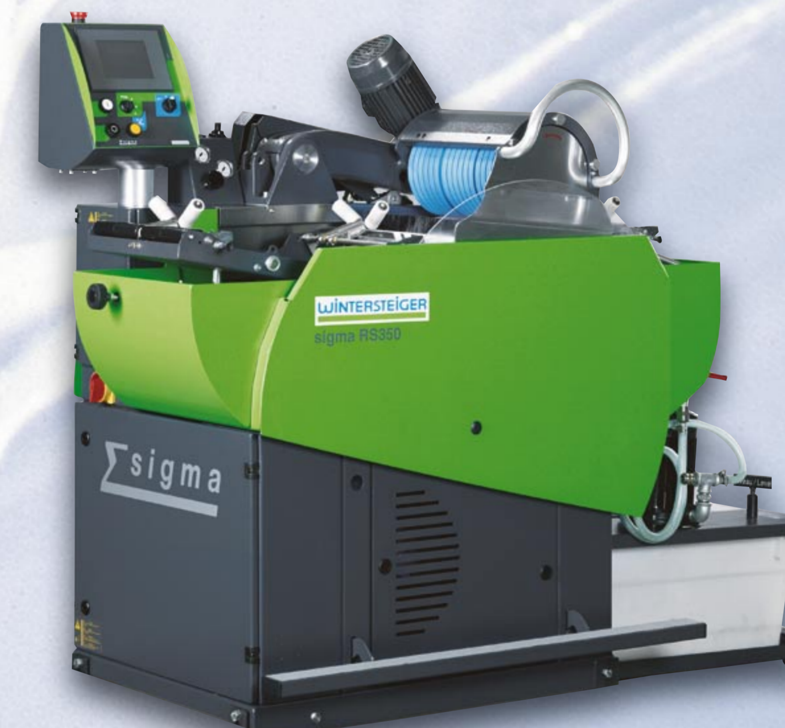
2003 sigma RS350

Manuelle Band-/Steinschleifmaschinen für Ski und Snowboards