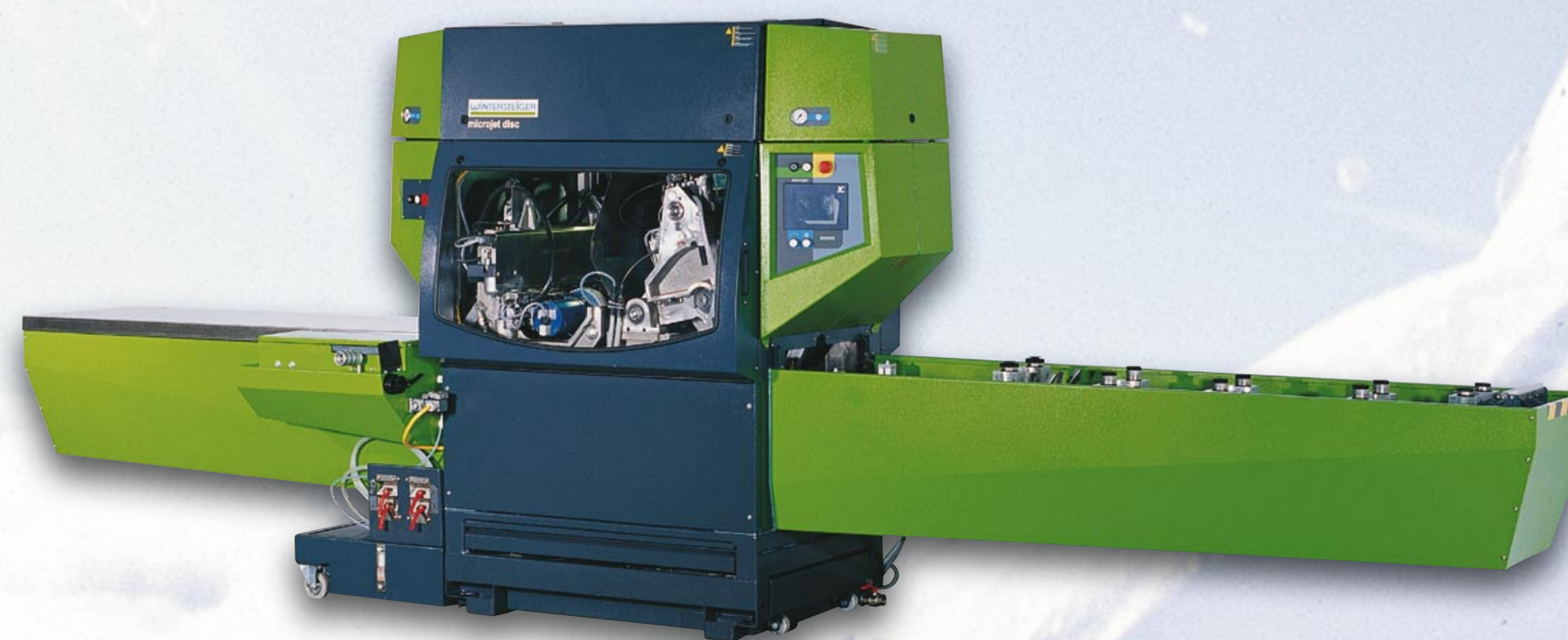
2001 microjet disc

1. Automatische Servicestation für Ski und Snowboards