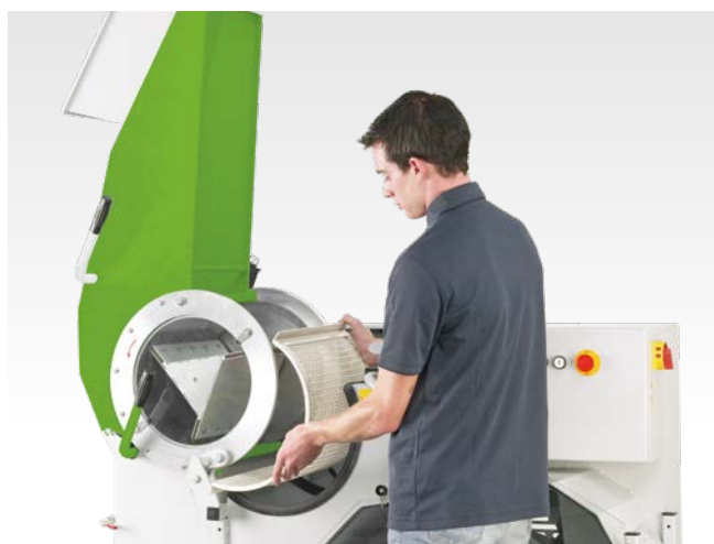
Troca do côncavo