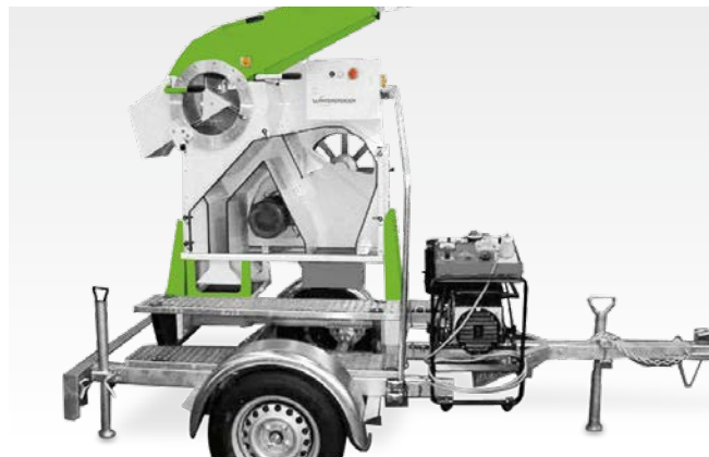
Reboque de um eixo com iluminação