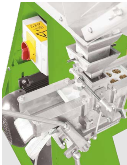
Dispositivo de enchimento do depósito opcional