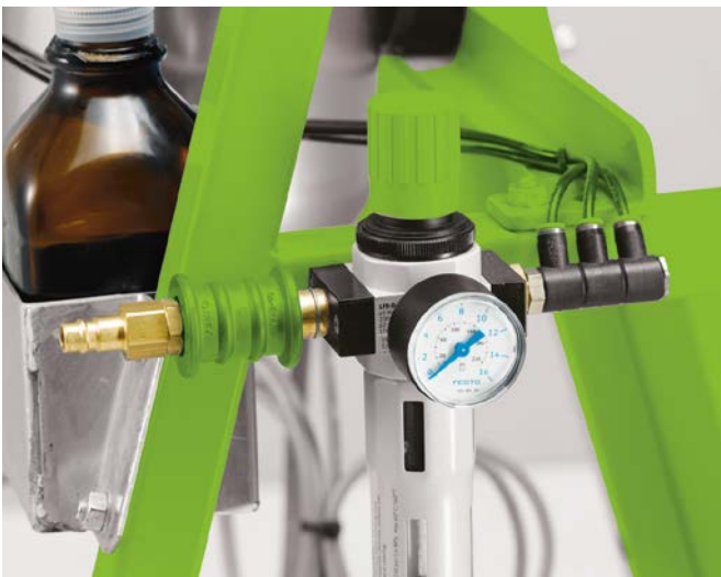
Opção: sistema de limpeza por injeção de ar