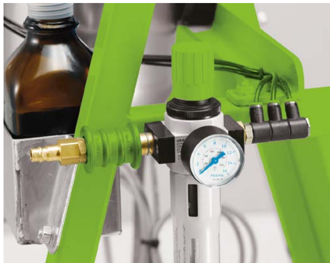
Опция: устройство для продувки