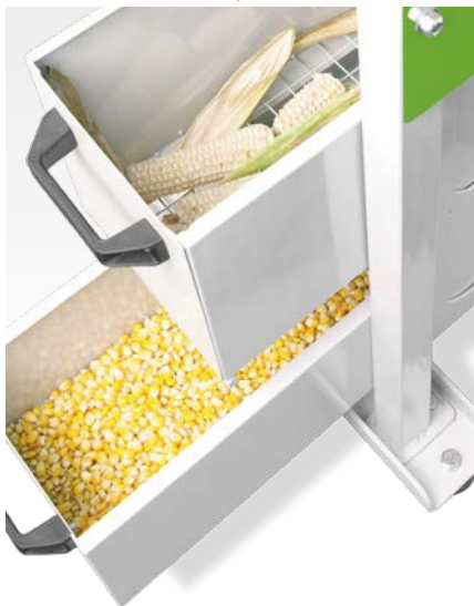
Лотки для зерна и стержней