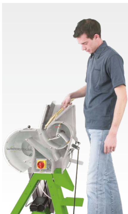
Подача колосков в молотилку