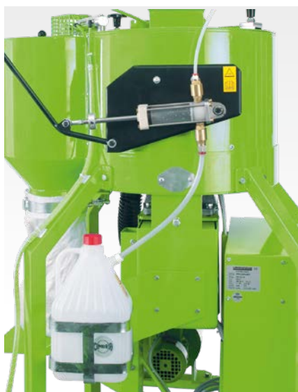
Насос - дозатор