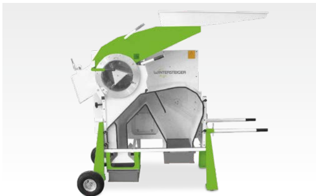
На двух колёсах

Варианты для передвижения и транспортировки WINTERSTEIGER LD 350: