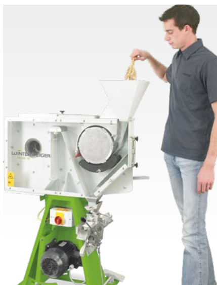
Подача колосков в молотилку