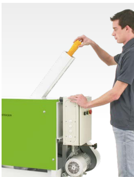
Подача початков в молотилку