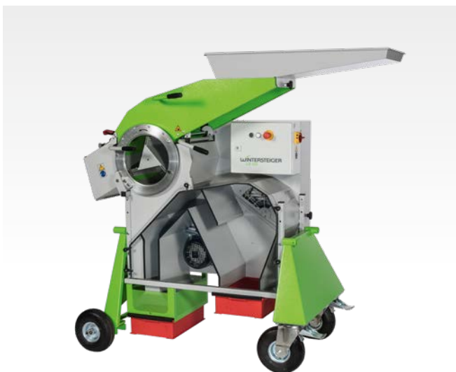
На четырёх колёсах