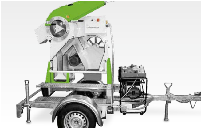
Remolque de un eje con iluminación