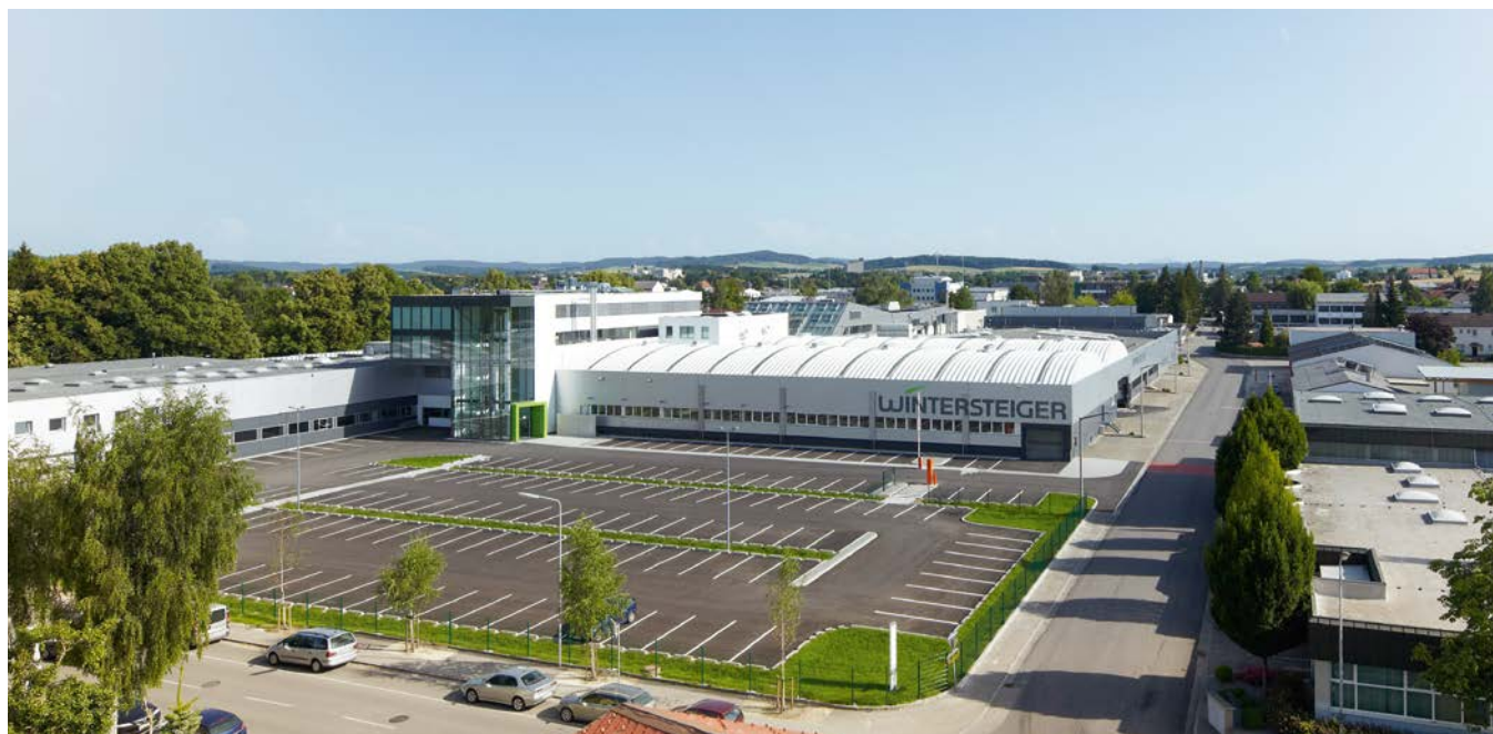
Casa matriz del consorcio en la localidad austriaca de Ried im Innkreis