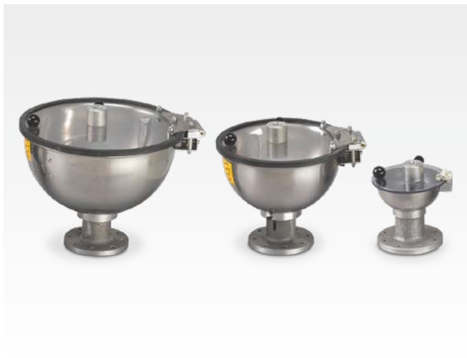
Depósito de desinfectante pequeño - mediano - grande