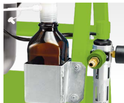
Dispensette con botella de vidrio marrón